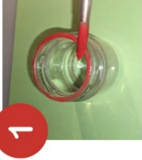
1. Glasrand anmalen