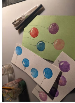
optional mit weißen Gelstift Akzente setzen/Glasfleck aufbessern